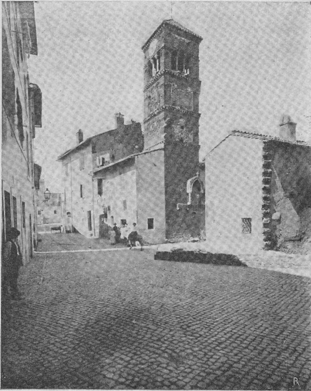
FRASCATI. — Campanile di san Rocco.